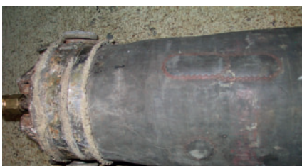
z.B. einen abgerissenen Deckel in einen alten Packergummi vulkanisieren