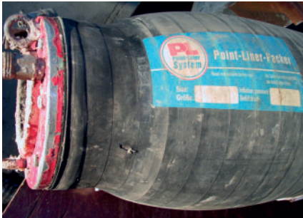
z.B. Loch am Umfang mit Gummi und Gewebe vulkanisieren