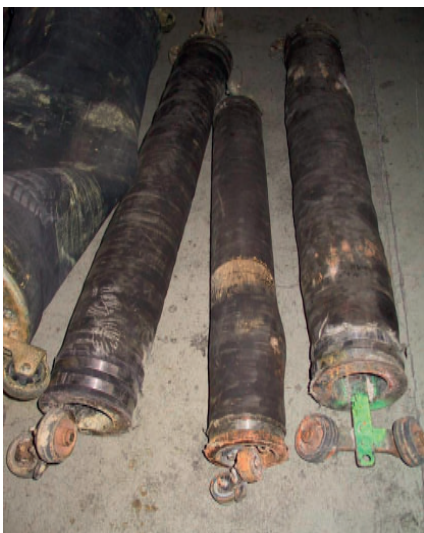
z.B. kompletter Außengummi wechseln und neu vulkanisieren