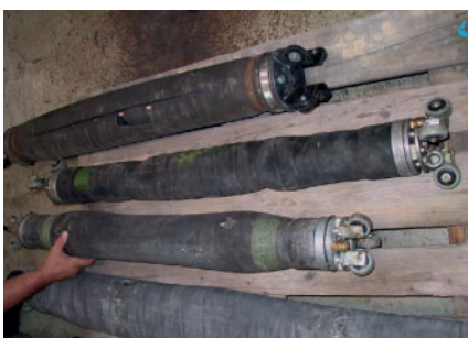
auch Reparaturen von Fremdfabrikaten sind möglich!!!