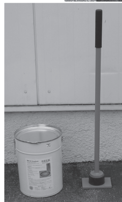
Beck-Handstamper Art. Nr.: ASP-ZU-004